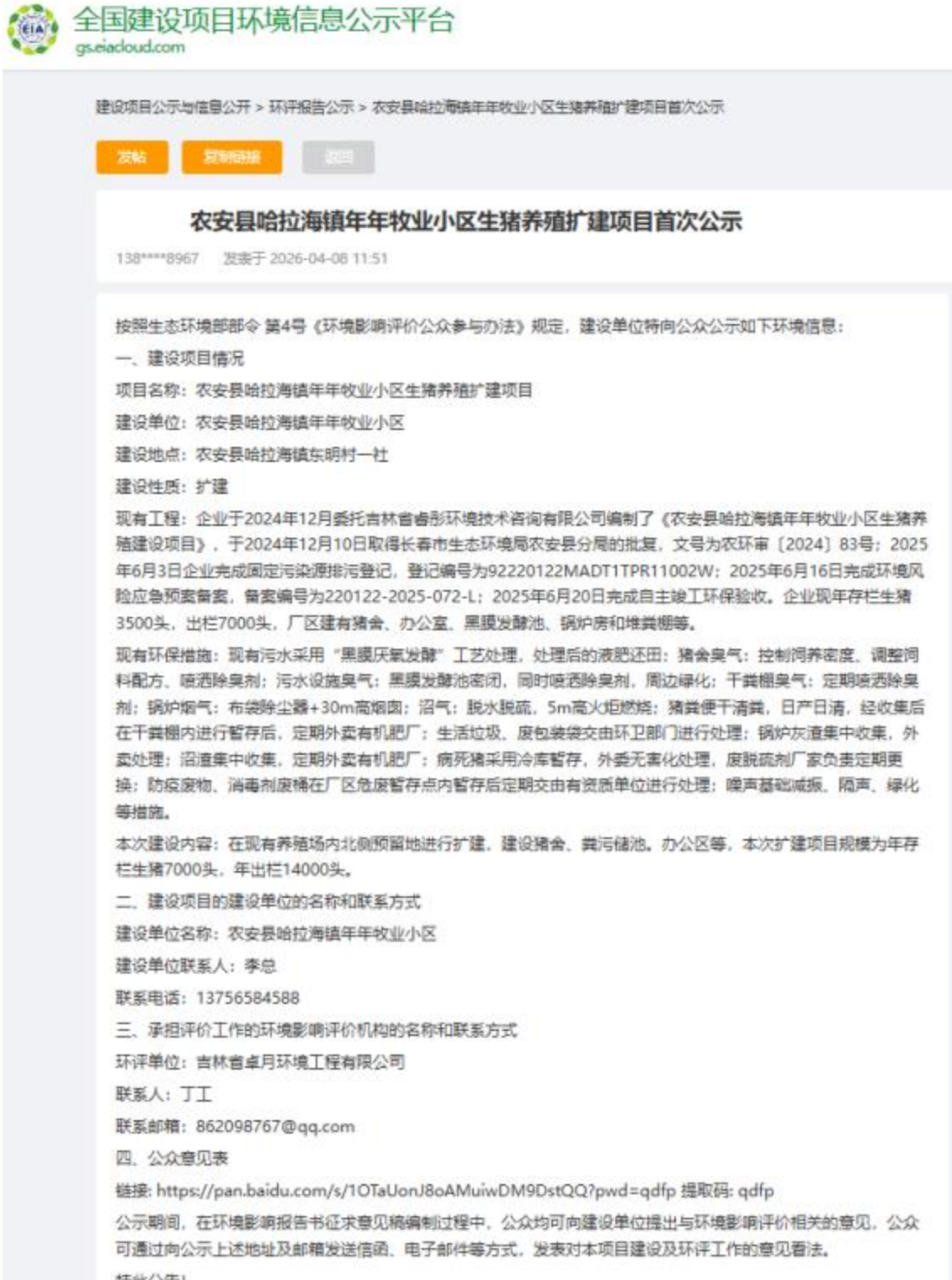
图 2-3 网络公示页面截图