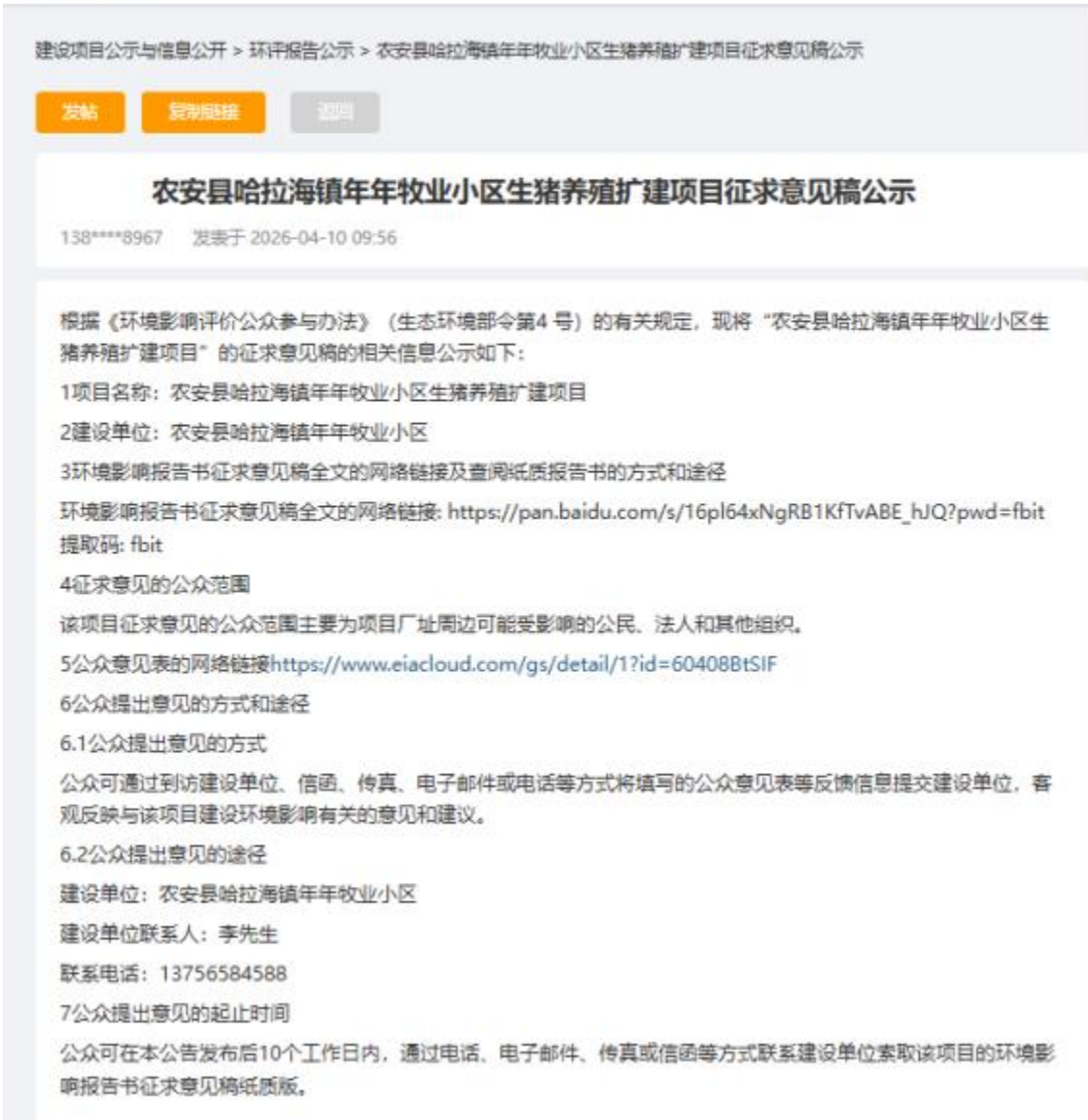
图 2-2 网络公示页面截图