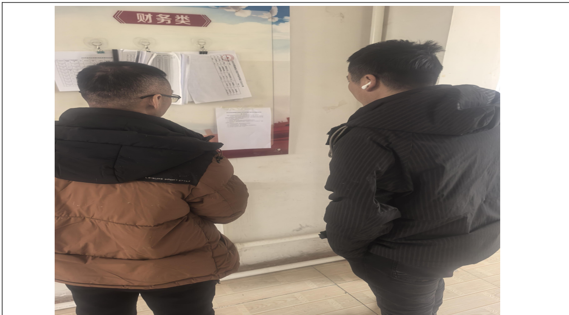
图 2-4 现场公告照片