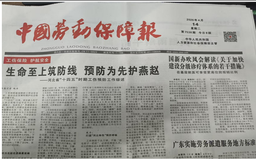
图 2-3 征求意见稿公示（二次公示）——报纸一次公示